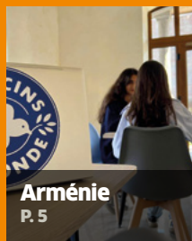
Arménie P. 5