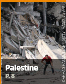
Palestine P. 8