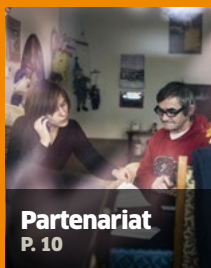
Partenariat P. 10