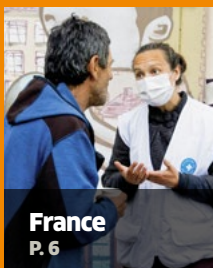
France P. 6