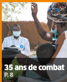
35 ans de combat P. 8