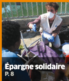
Épargne solidaire P. 8