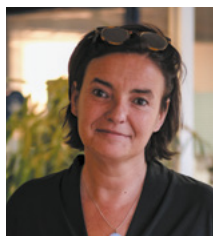
Dr Carine Rolland Présidente de Médecins du Monde

Médecins du Monde plaide pour un changement radical de paradigme, pour une société plus solidaire, plus inclusive, plus juste. ●