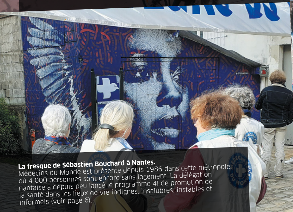
La fresque de Sébastien Bouchard à Nantes. Médecins du Monde est présente depuis 1986 dans cette métropole, où 4 000 personnes sont encore sans logement. La délégation nantaise a depuis peu lancé le programme 4I de promotion de la santé dans les lieux de vie indignes, insalubres, instables et informels (voir page 6).