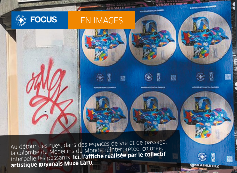
Au détour des rues, dans des espaces de vie et de passage, la colombe de Médecins du Monde réinterprétée, colorée, interpelle les passants. Ici, l'affiche réalisée par le collectif artistique guyanais Muzé Laru.