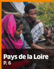
Pays de la Loire P. 6